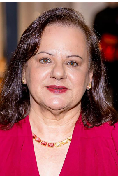
Desembargadora Ana Lúcia Lourenço

sobre as decisões e atos expedidos; atualizar o Código de Normas que regem as atividades de todos os cartórios; implantação do Selo Digital de Fiscalização que é um conjunto de soluções tecnológicas elaborado com o objetivo principal de aprimorar a segurança dos atos praticados nas serventias extrajudiciais; implantar em todas as unidades núcleos de conciliação e mediação; estabelecer canais de diálogos permanentes com os juízes corregedores e agentes delegados através do programa “foro extrajudicial em debate” de modo a trazer temas de repercussão para discussão e em sendo possível criarmos enunciados; criar o prêmio de qualidade da Corregedoria para os cartórios; promover estudos de reestruturação das unidades do foro extrajudicial do Estado e muitas outras medidas.